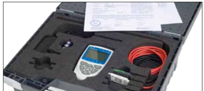
Set im stabilen Hartschalenkoffer (PHYSICS 300, Fühler, DKD-Zertifikat, Netzteil und USB-Kabel enthalten)