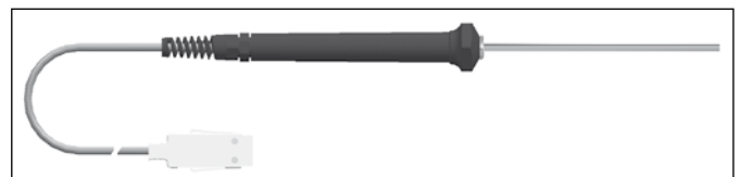
Messfertig programmiertes Thermoelement Typ K